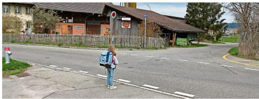
Bis zum Schulraumbezug in Gotzenwil muss für die Iberger Kinder auch der Schulweg - unter anderem die Überquerung der Weierstrasse - gesichert werden.

Anfangs Jahr sorgte in Iberg die Meldung, dass die Erstklässler nach Gotzenwil zur Schule müssten, für Aufregung. Zusätzliche Pannen führten dazu, dass das Schulprovisorium an der Eidbergstrasse noch immer nicht bezogen werden kann und die Iberger Kinder voraussichtlich bis zu den Sportferien 2020 per Schulbus nach Seen gefahren werden müssen.